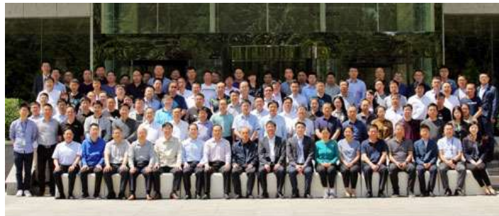
河北省电子商务进农村综合示范培育与创新发展高级研修班