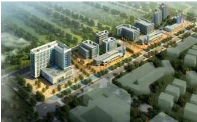
天津电子商务产业园传统转型升级