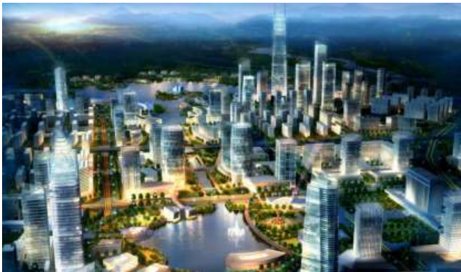
郑州跨境电子商务综合试验区